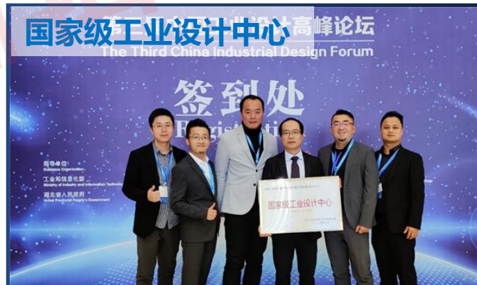
国家级工业设计中心高峰论坛 The Third China Industrial Design Forum