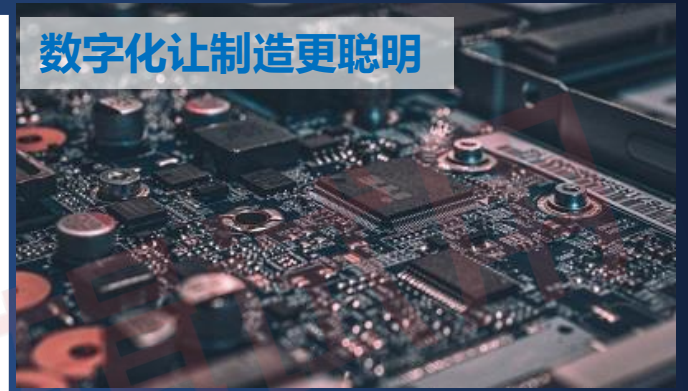
数字化让制造更聪明