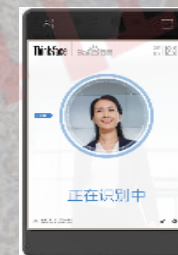
智能安防/智能 支付设备