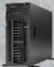
国产自主可控 服务器