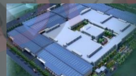
联想科技总部 (合肥)