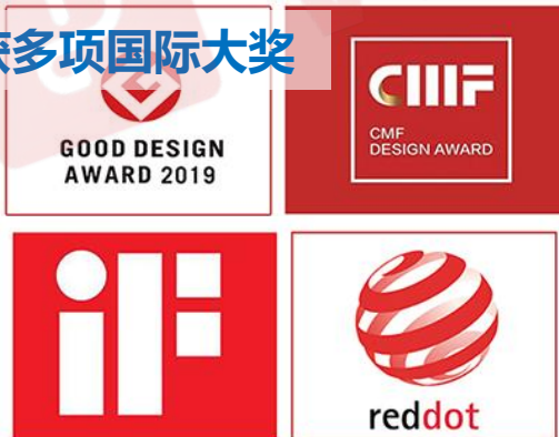
斩获多项国际大奖