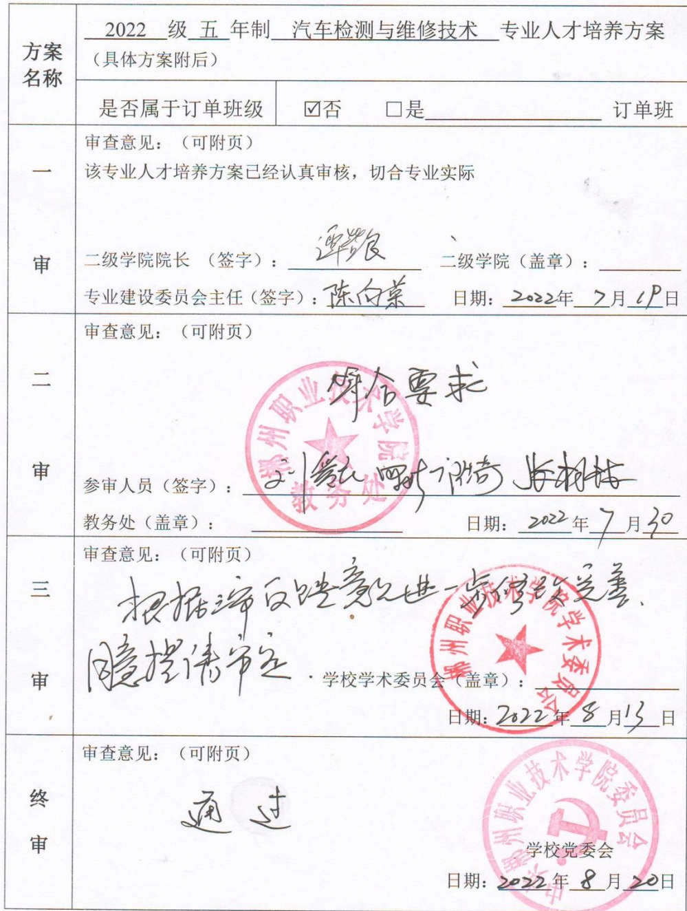
郴州职业技术学院专业人才培养方案制定审批表