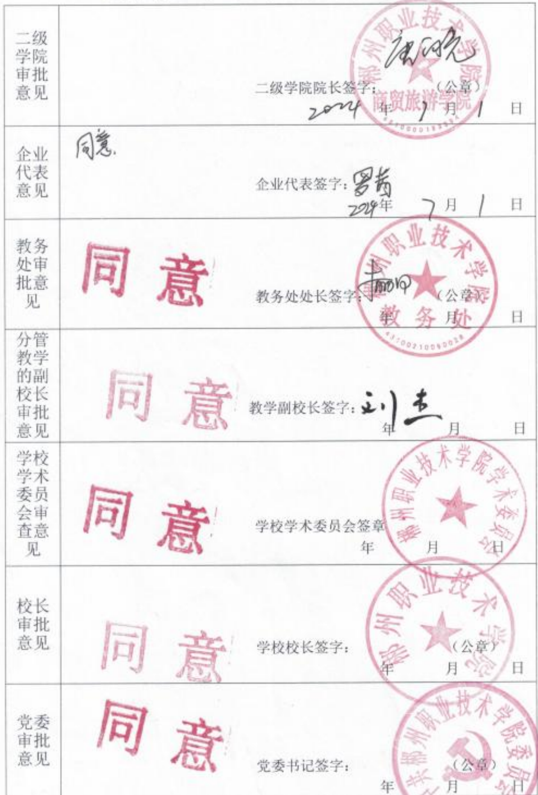
旅游管理专业人才培养方案审批表