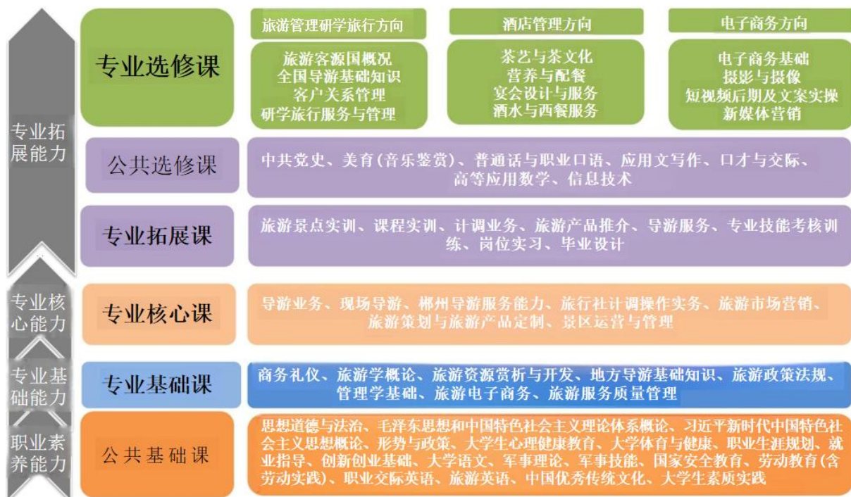
图1 基于职业能力分析构建的课程体系

通过对旅游管理专业相关企业及上海迪士尼度假区对人才需求的调研,将企业岗位设置及职业能力进行梳理,依据能力层次划分课程结构,整合具有交叉内容课程,结合人才培养目标,本专业课程设置有公共基础课、专业基础课、专业核心课、专业拓展课及选修课(公共选修课与专业选修课)等5类课程,总共48门课。