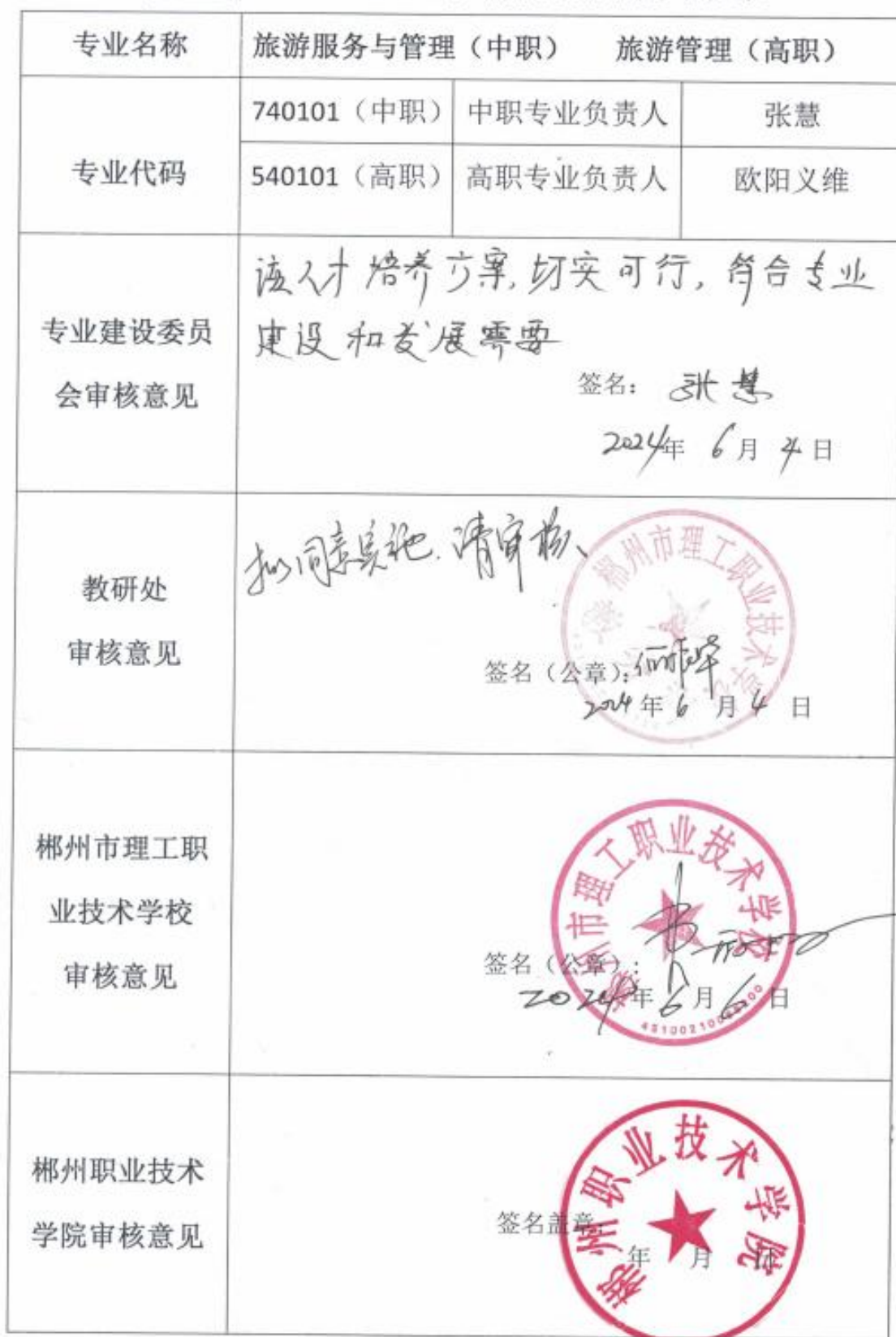
2024 级三二分段人才培养方案制定审批表